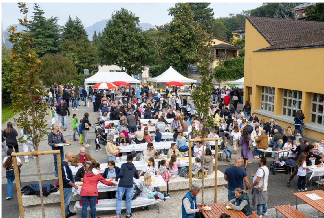
Giornata di festa il 4 ottobre 2025 per l'inaugurazione della ristrutturata Scuola elementare