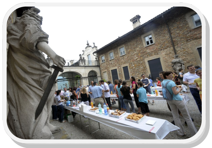
Colazione a Villa Negroni

Una giornata importante e divertente; scollinando è una manifestazione che senza dubbio verrà riproposta anche il prossimo anno. Gli organizzatori, ricchi dell'esperienza maturata, certamente metteranno a disposizione ulteriori iniziative, per offrire alla comunità di Vezia e ai partecipanti degli altri Comuni un momento conviviale di grande spessore ludico - culturale.