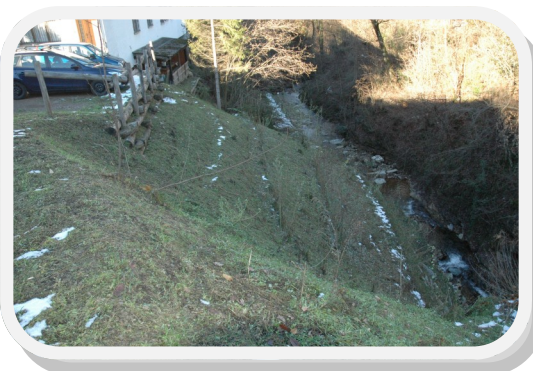
Opere di consolidamento del riale

Negli ultimi tempi la situazione si era addirittura ulteriormente aggravata, a causa dei forti temporali che avevano colpito la zona.