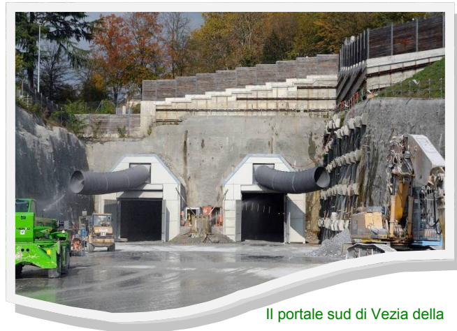
Il portale sud di Vezia della galleria del Monte Ceneri